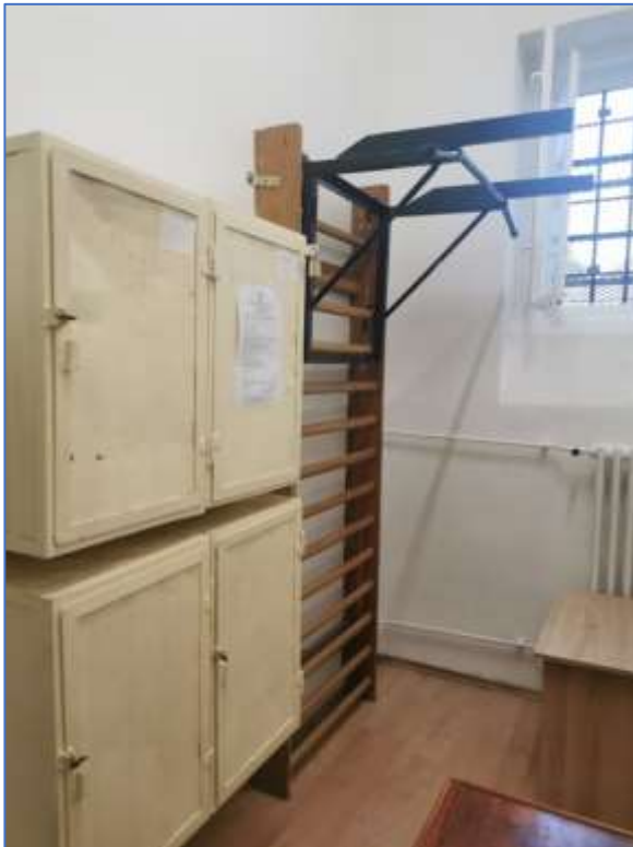
Fogvatartotti kondihelyiség eszközei