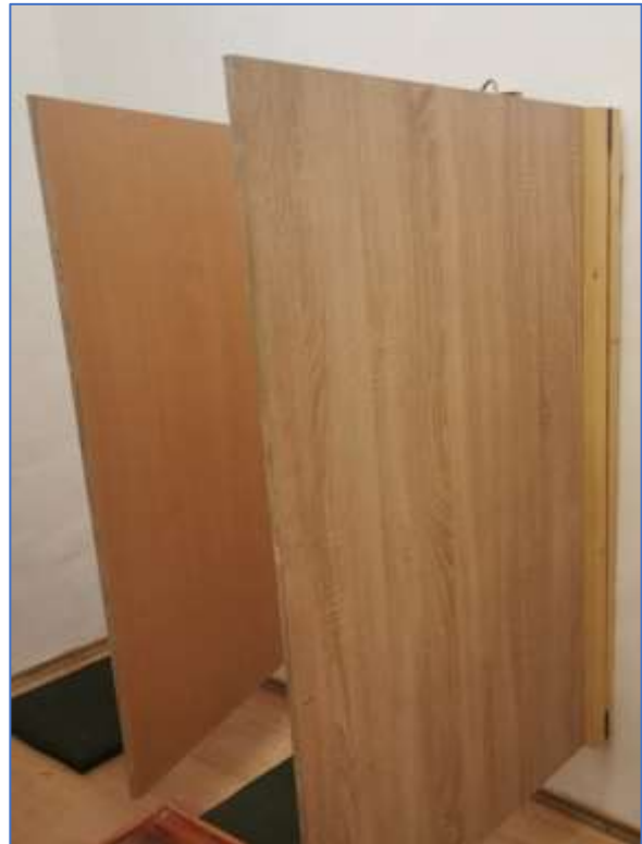
A fogvatartotti kondihelyiségben kialakított átvizsgáló rész