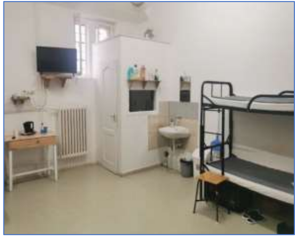
Lefalazott wc az egyik nagy zárkában