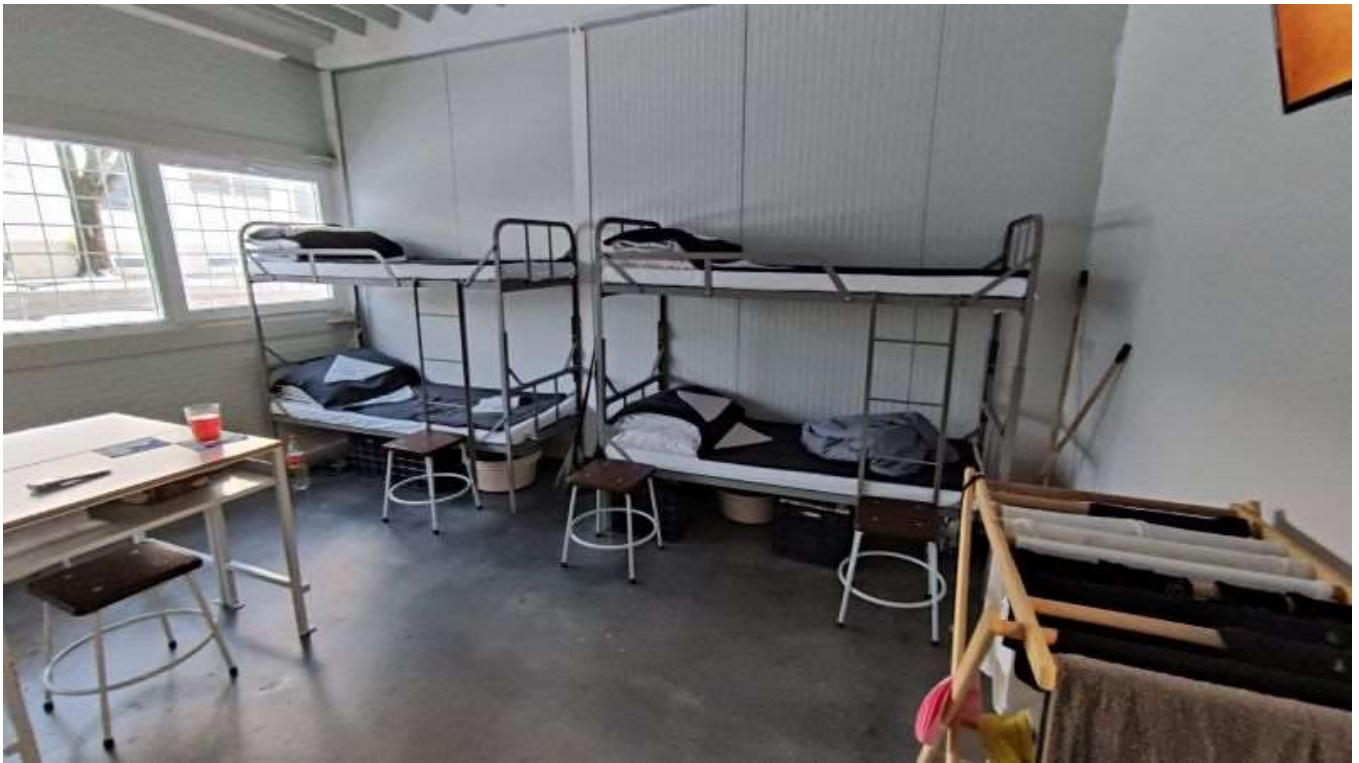
Egy 11 ágyas zárka (2021)