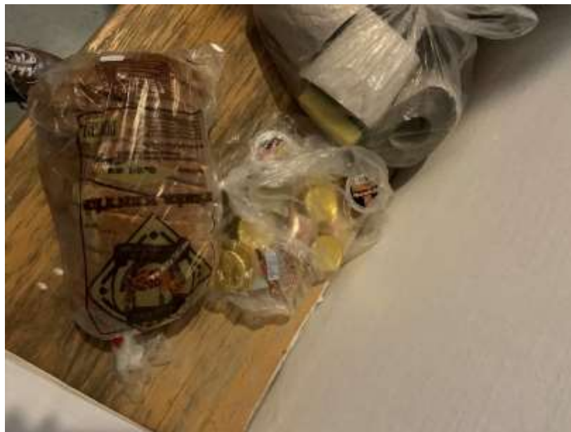
13. számú kép: Kenyér és tisztasági csomag