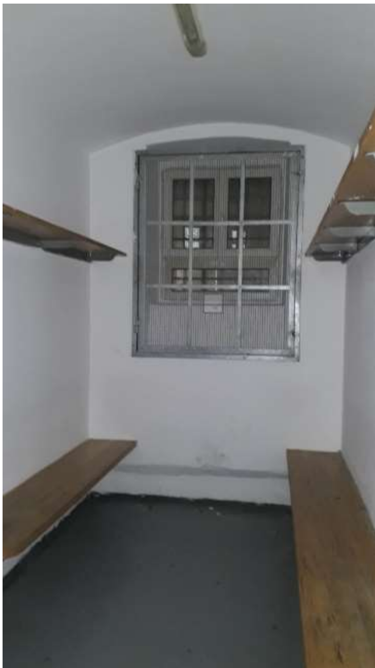
1. számú kép: Kifestett szállító zárka