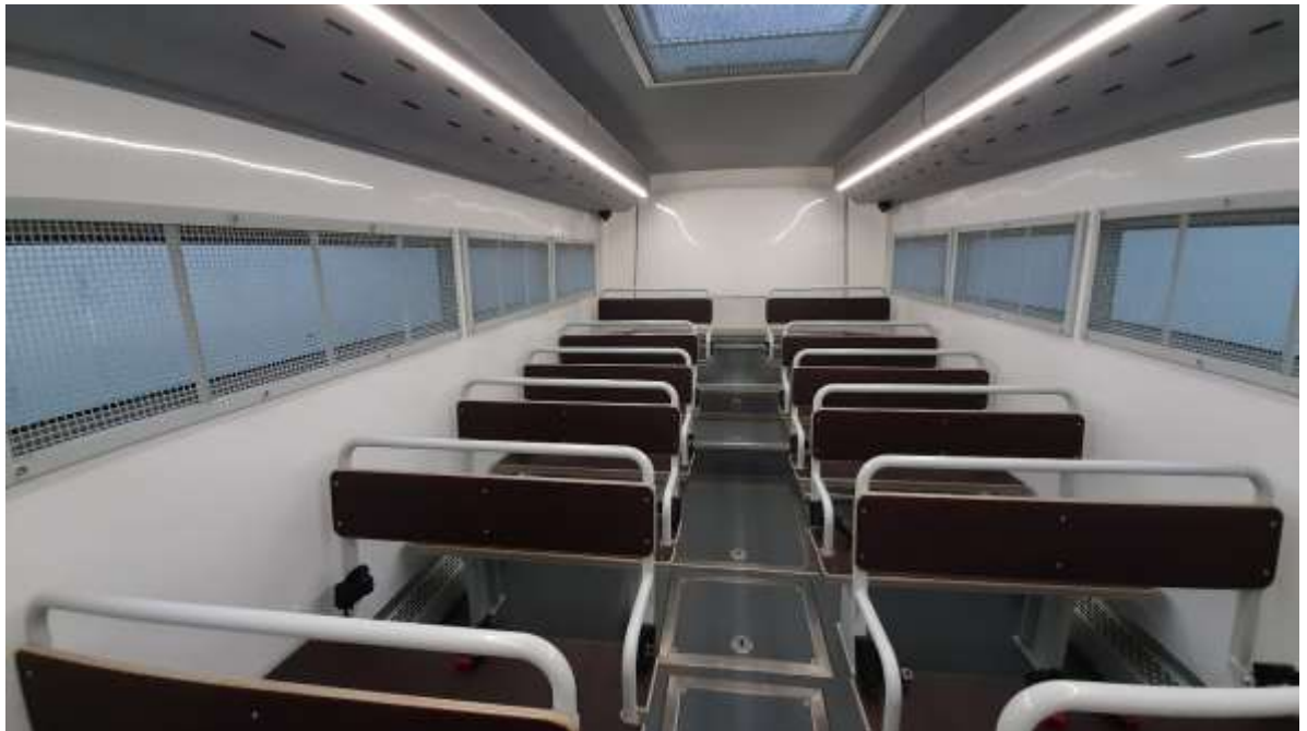
8. számú kép: Új típusú szállító busz biztonsági övekkel