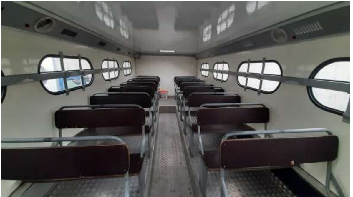
9. számú kép: Régi típusú busz biztonsági övek nélkül