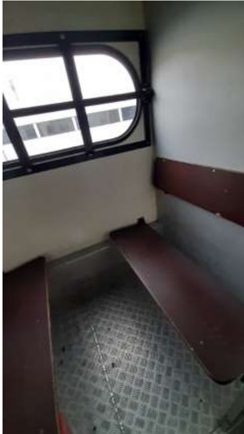
10. számú kép: Négyfős elkülönítő helyiség a szállító járművön