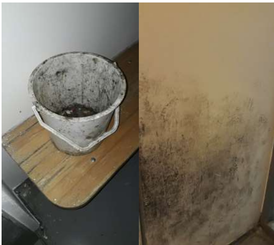
4.számú kép: Koszos szemetes kuka