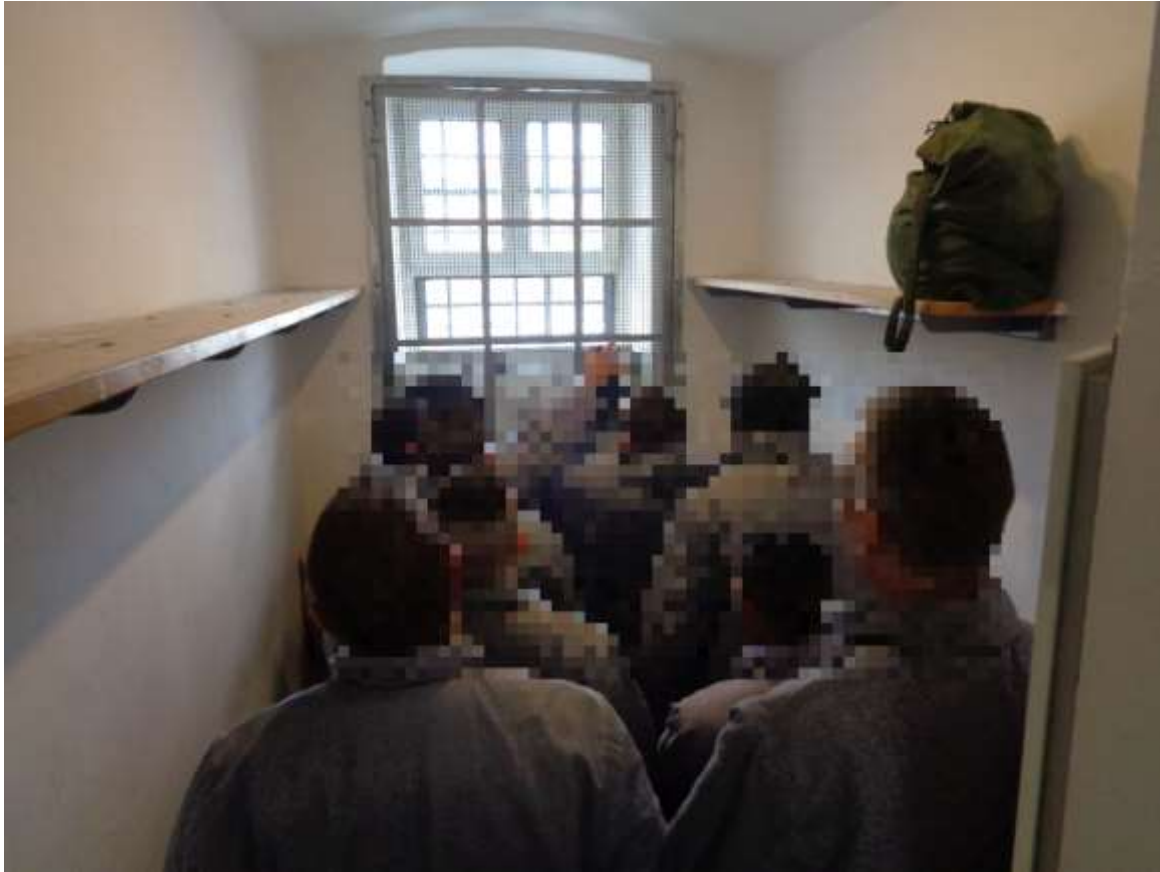
7. számú kép: Zsúfoltság a szállító zárkában