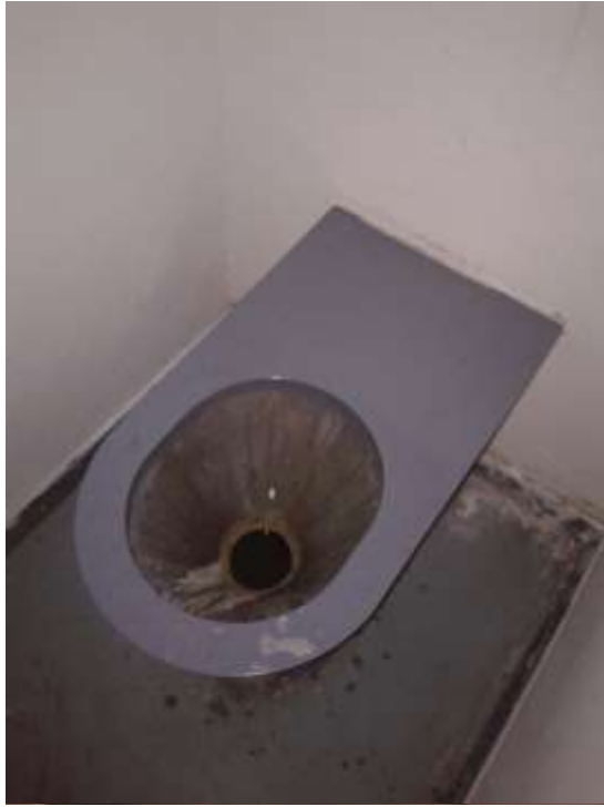
2.számú kép: Felújítandó WC csésze