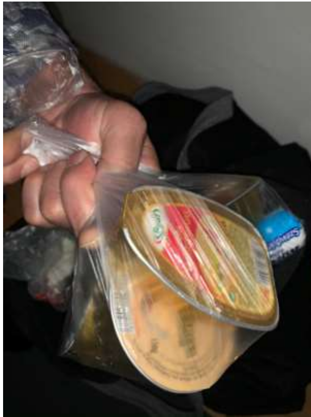
12. számú kép: Élelmiszer csomag