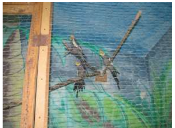
I/6. Terápiás állatok a fiatalokú férfiak körletén