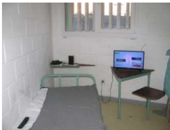
II/6. Fiatalkorú fiúk zárkája