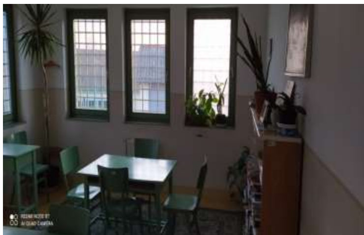
II/7. Közös helyiség