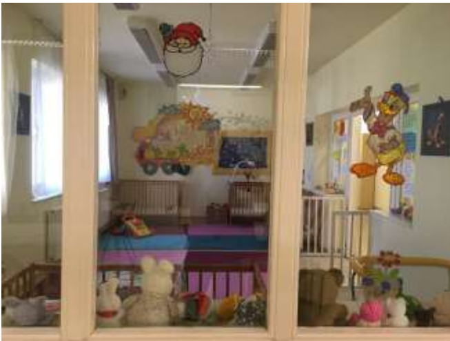
I/3. Közös helyiség a II. Objektum anya-gyermek részlegén