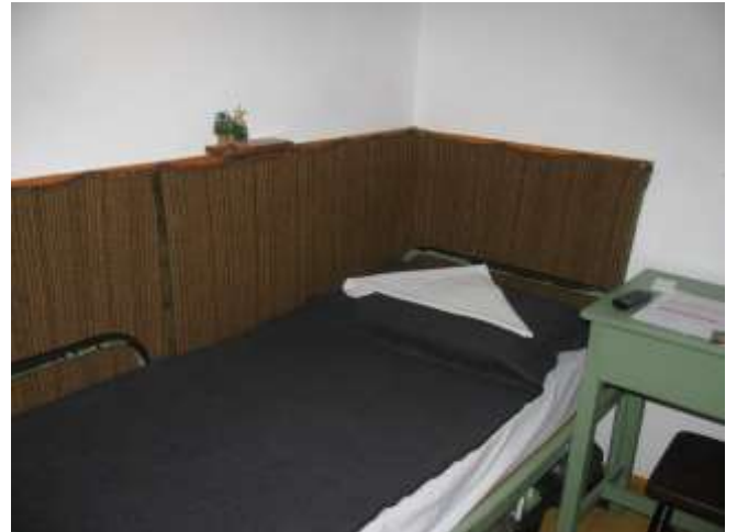
I/2. Lakóhelyiség a II. Objektumban – „B-C” körlet