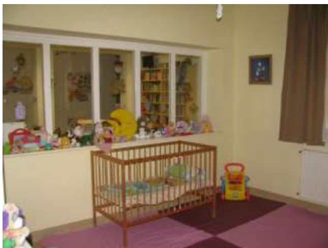
II/1. Közös helyiség az anya-gyermek körleten