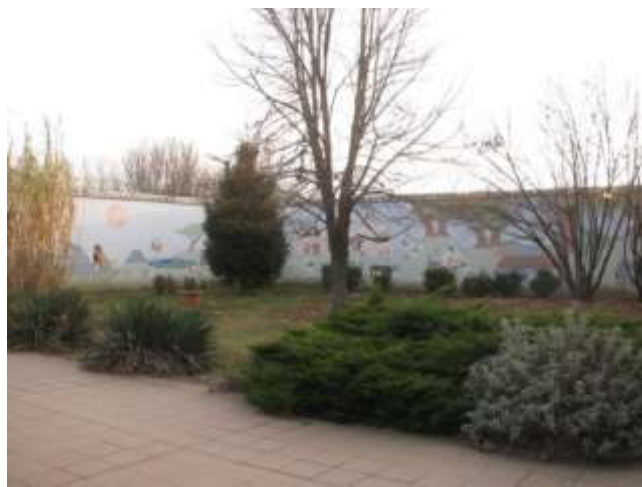
II/2. Anya-gyerek udvar