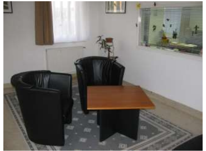
I/4. A gyermekláthatás lebonyolítására szolgáló helyiség a II. Objektum anya-gyermek részlegén