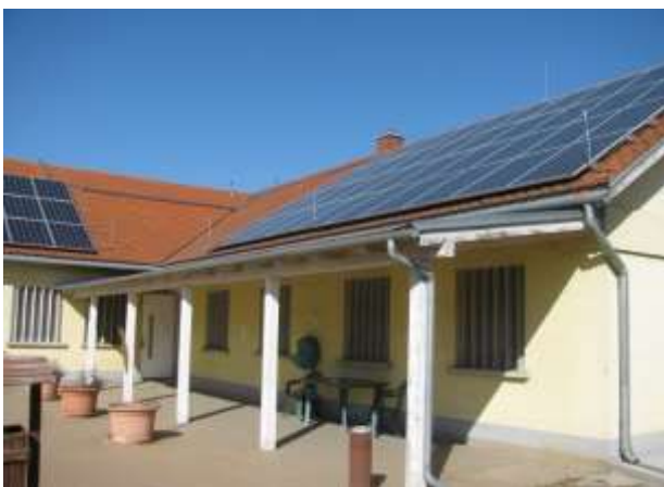
I/5. Fedett rész a II. Objektum udvarán