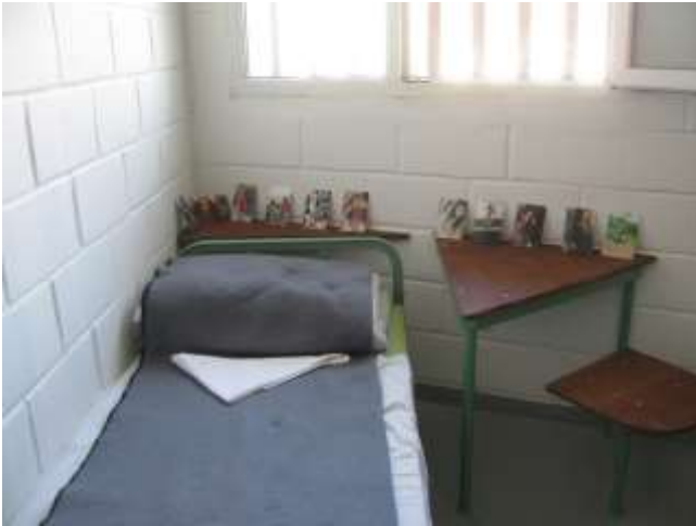
I/1. Zárka a II. Objektumban – fiatalokú férfiak körlete