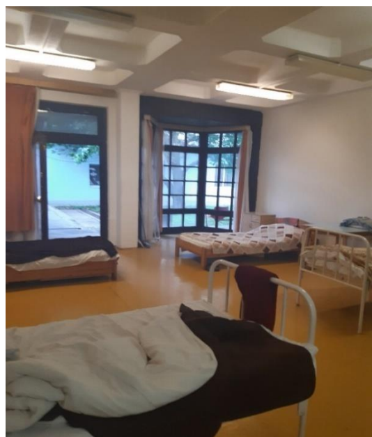
5. számú ápolási egység, közösségi tér, intim szoba, lakószobák,