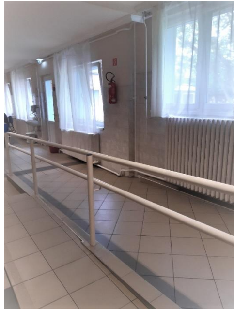
1. számú ápolási egység, akadálymentesített folyosó