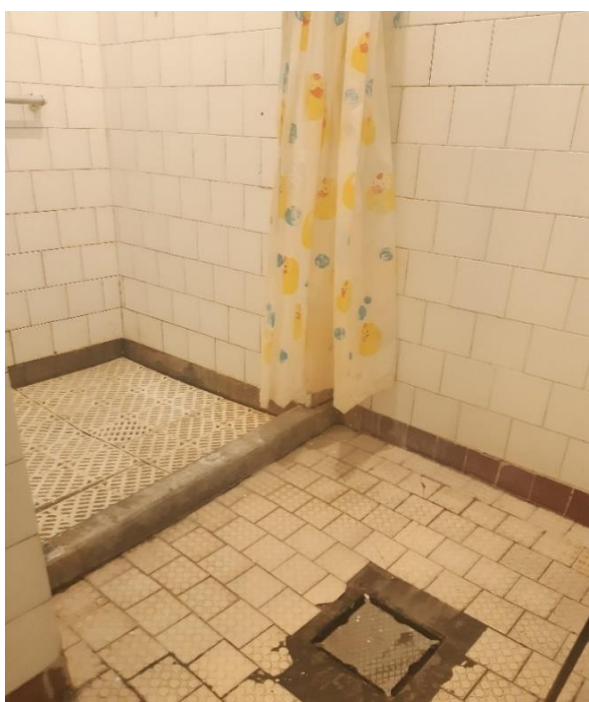
5. számú ápolási osztály, vizesblokk,