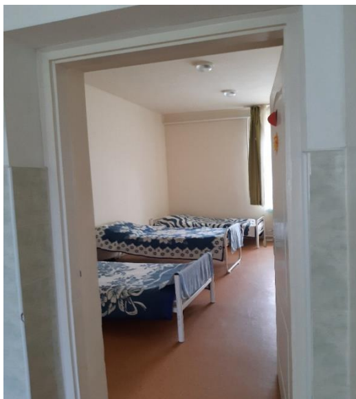
2. számú ápolási egység bejárata, lakószobák