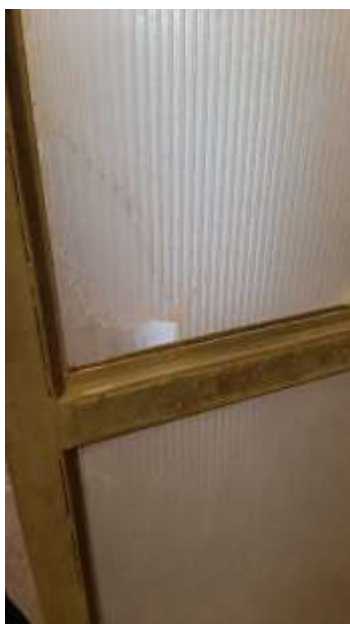
3. Kitorótt zuhanyfal az “A részlegen” (2019)