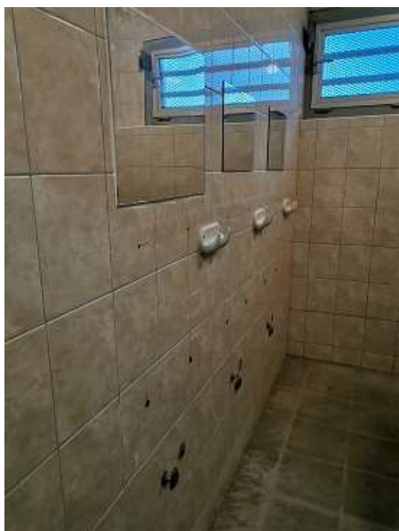
20. Fürdő az „A részlegen” – hiányzó mosdók (2020)