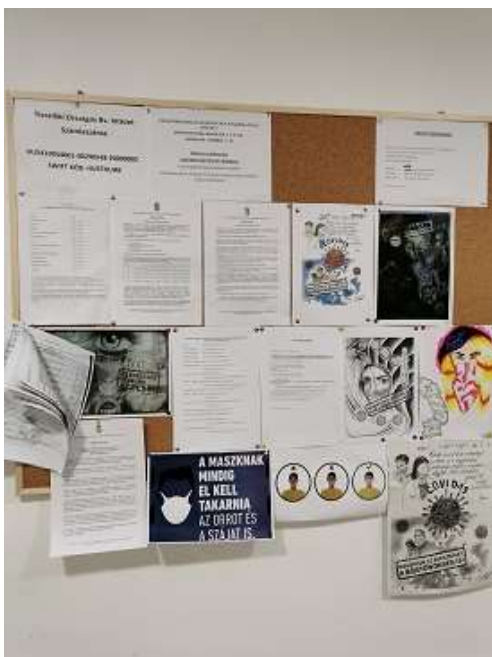
22. Faliújság, fogvatartotti tájékoztatók (2020)