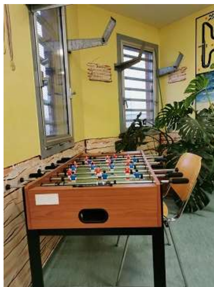
19. Foglalkoztató helyiség - a képen a veszélyes ablaknyitó szerkezet is látható (2020)