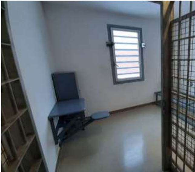
15. A fogda egy zárkája (2019)