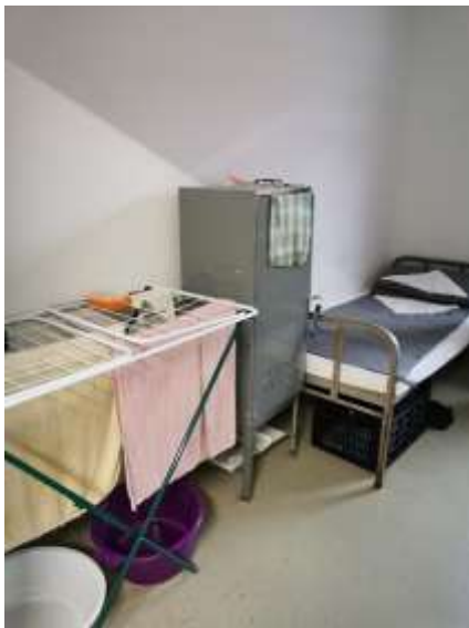
16. Zárka az „A részlegen” (2020)