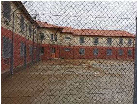
9. A régi „A részleg” egyik épülete sétaudvarral (2020)