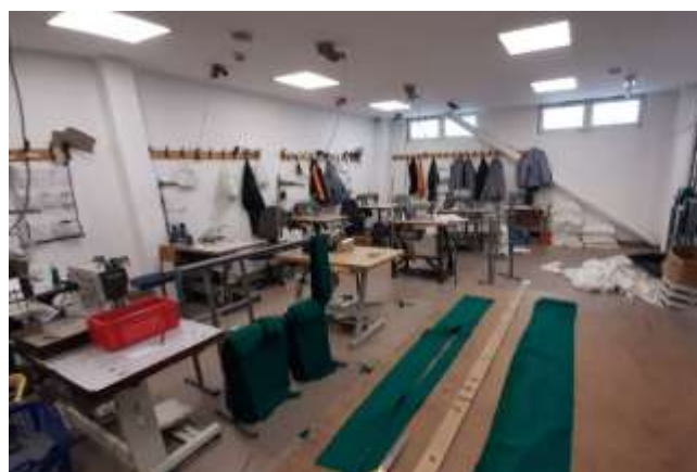
26. Varróda (2019)