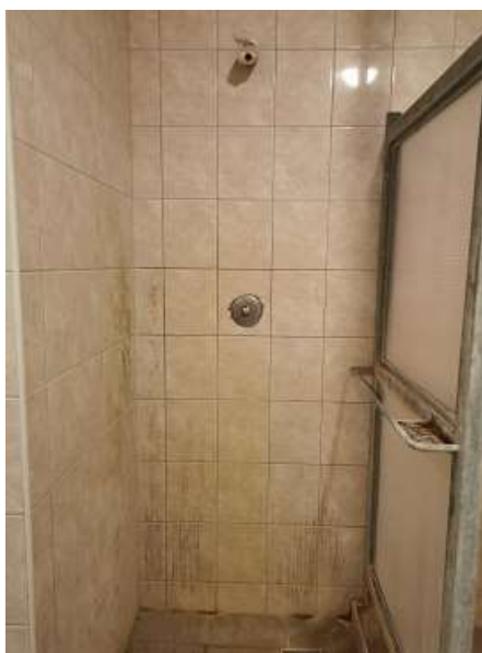
4. Zuhanyzó az „A részlegen” (2020)