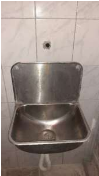
5. Hiányzó csap (2019)