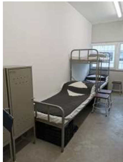
17. Lakóhelyiség a „B részlegen” (2020)