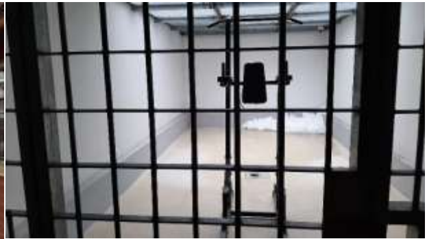
8. HSR sétaudvar (2019)