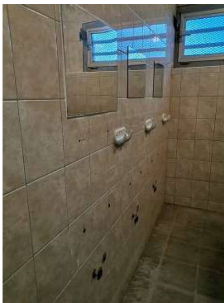
2. Fürdő az „A részlegen” – hiányzó mosdók (2020)