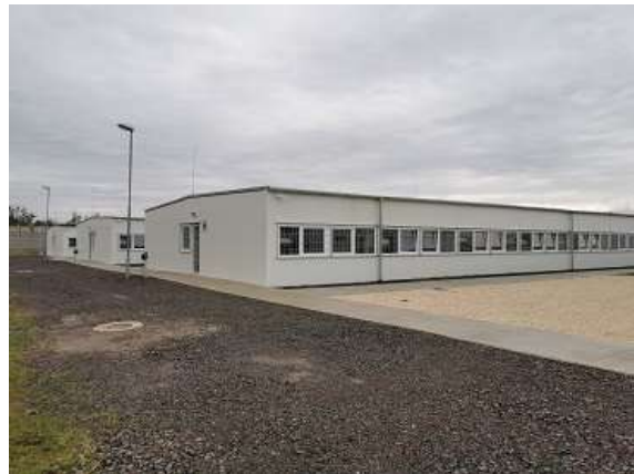
10. Az új, könnyűszerkezetes „B részleg” (2020)