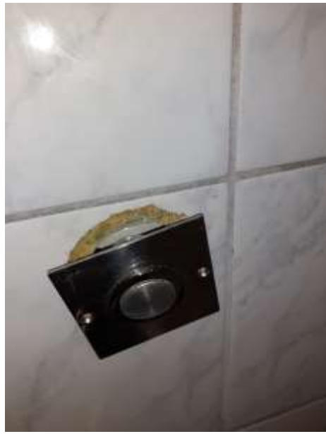
6. Hibás zuhanygomb (2019)