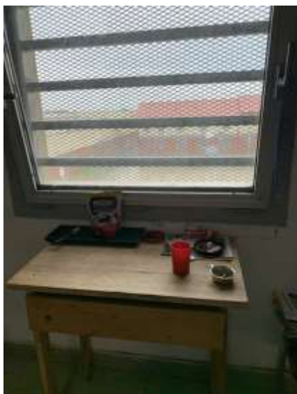
18. Sűrű rácsozat az ablakon (2020)