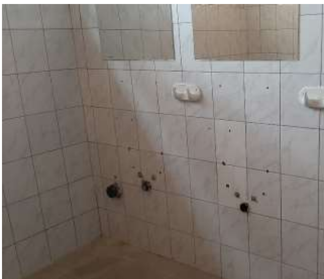
1. Fürdő az „A részlegen” – hiányzó mosdók (2019)