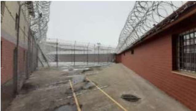
7. Sétaudvar (2019)