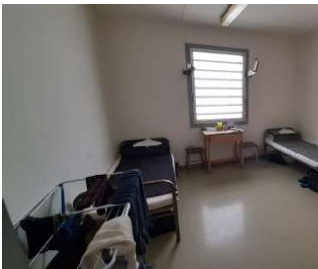
13. Kétágyas zárka (2019)