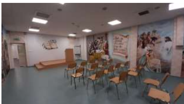
25. Kápolna (2019)