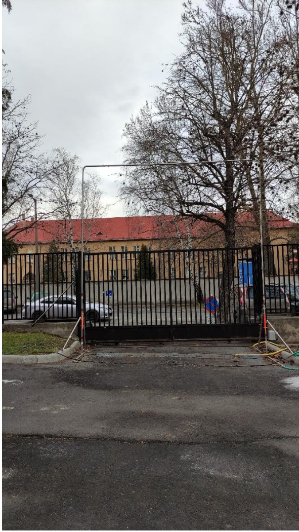
13. A gépjárművek fertőtlenítésére szolgáló kapu