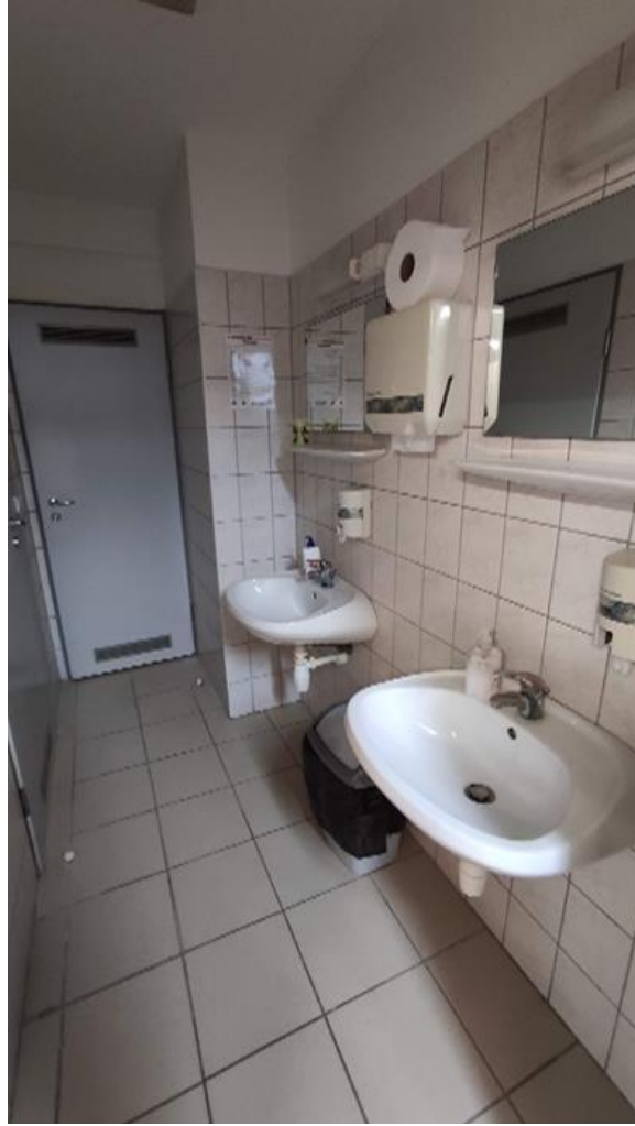
10. Személyzeti öltöző mosdóhelyisége