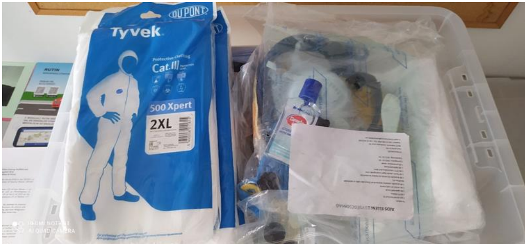
7. Szolgálati gépkocsik csomagterében található védőfelszerelések