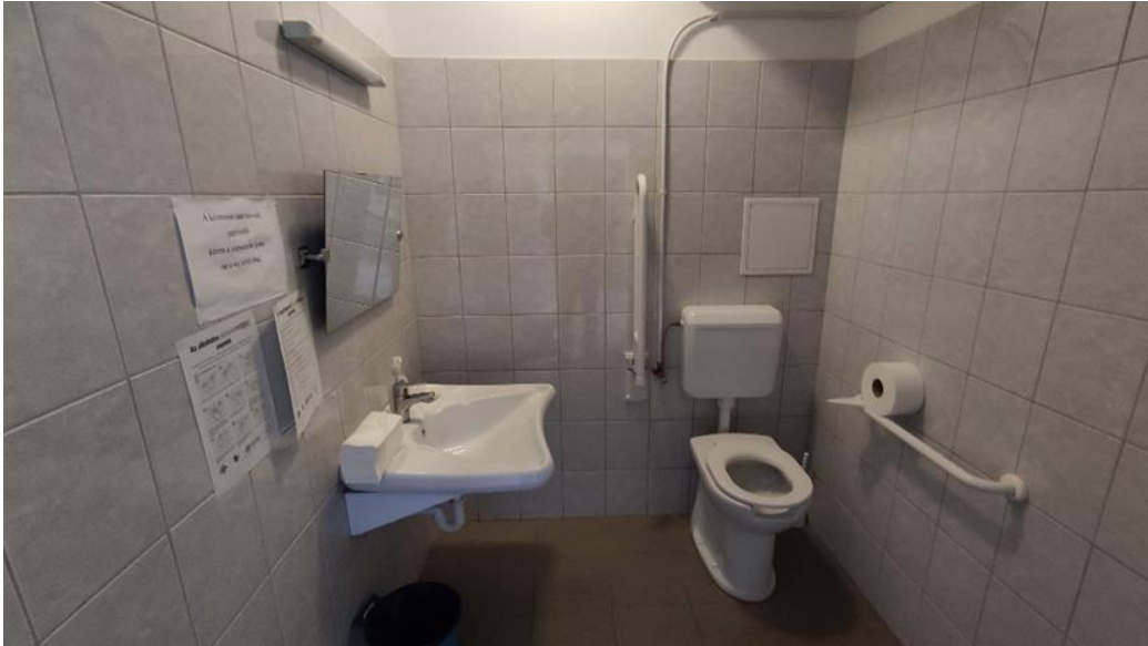
8. Akadálymentes WC az Objektumban