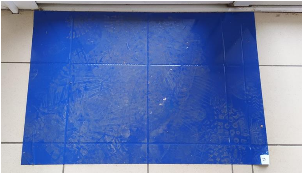
9. Cserélhető cipőfertőtlenítő szőnyeg az Objektum udvari bejáratánál