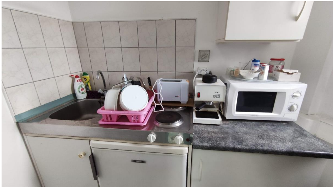
12. Egy teakonyha az Objektumban