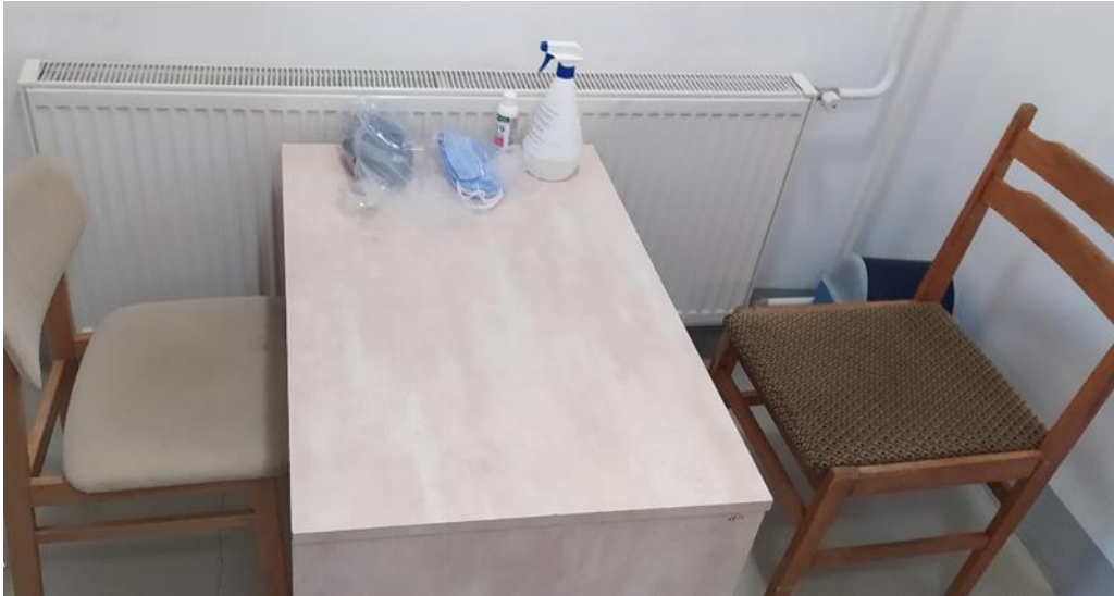
6. Az előállító egység előterében elhelyezett védőfelszerelés és fertőtlenítő szerek