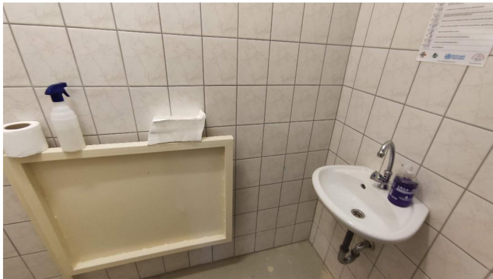
5. A fogvatartottak számára kijelölt mosdó