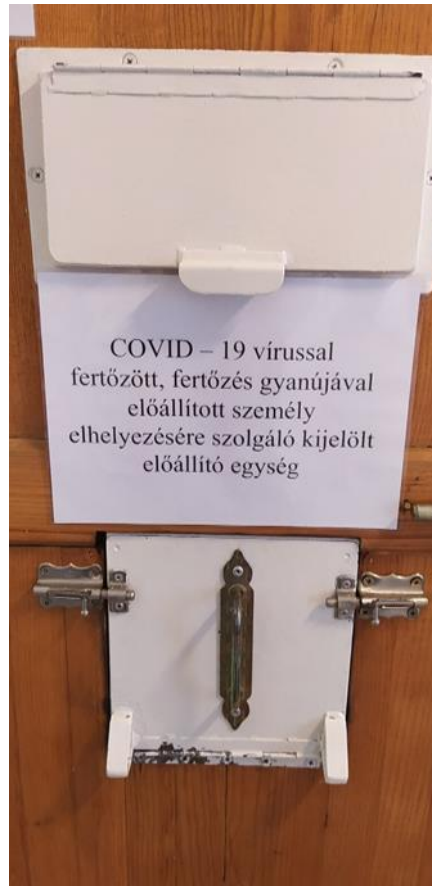
4. Az előállító egység bejárata