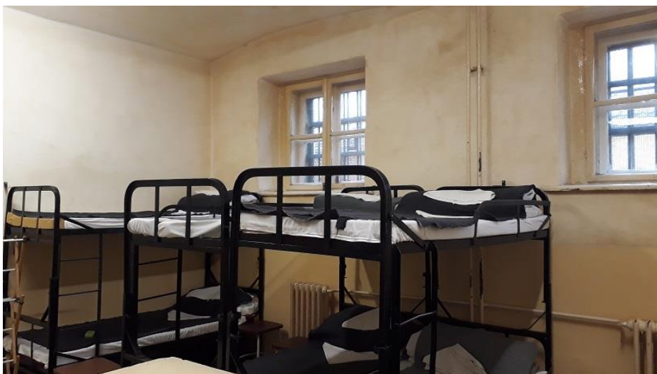
1. Zárka a Székely épületben