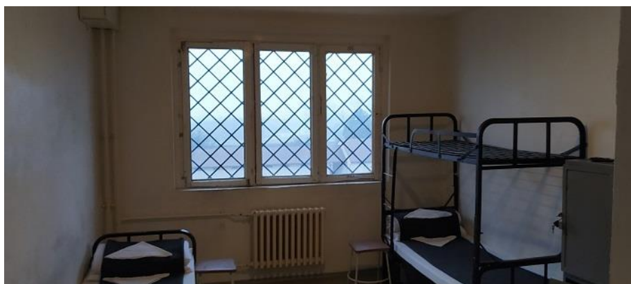
2. Zárka a Telephely F épületében