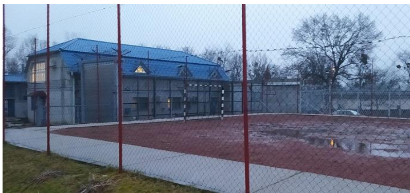
7. Sétaudvar a Telephelyen