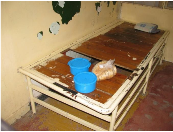
5. Fegyelmi zárka