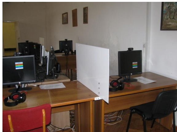
10. Skype végpontok a kultúrteremben