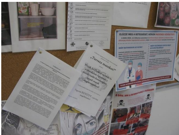
9. Faliújság, fogvatartotti tájékoztatók