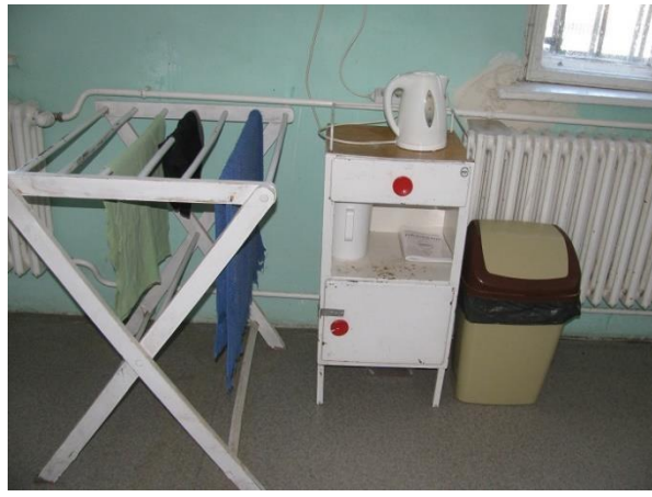
6. Kórterem az egészségügyi részlegen