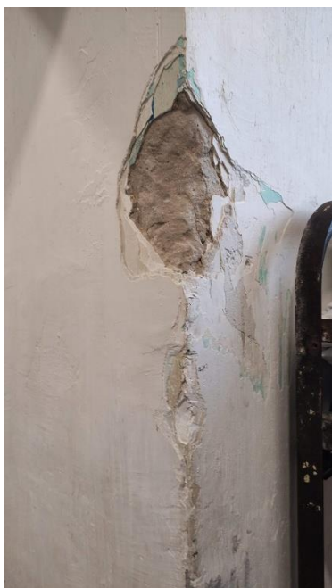
2. Zárka – málló fal