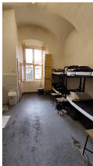
4. Zárka- töredezett padló