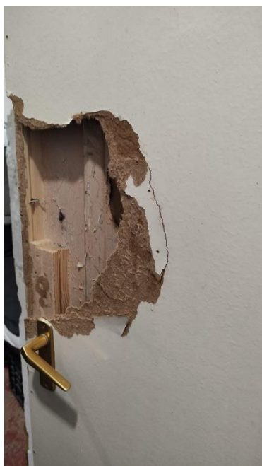
3. Zárka – megrongálódott ajtó