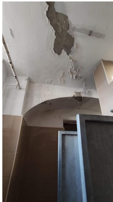
8. A fürdőhelyiség mennyezete