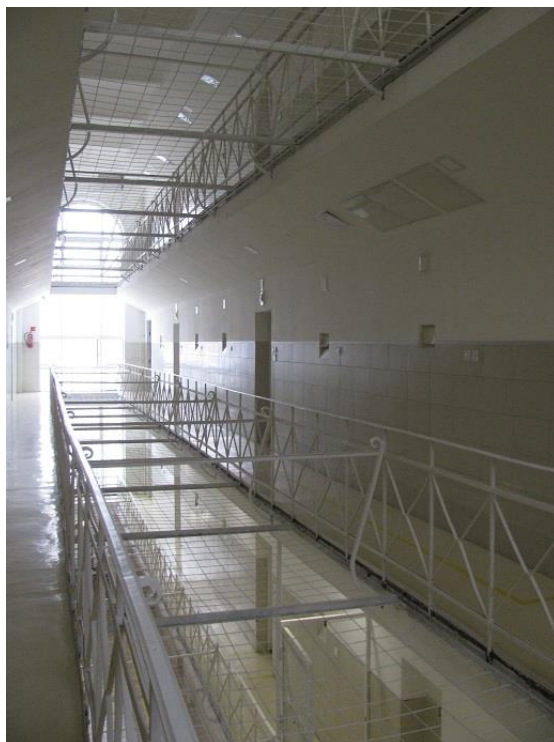
1. Felújított körletfolyosó