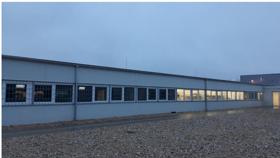
3. Új, könnyűszerkezetes épület a Telephelyen