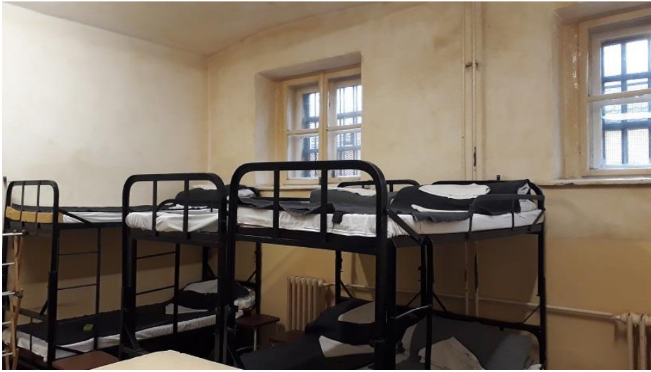
1. Zárka a Székely épületben