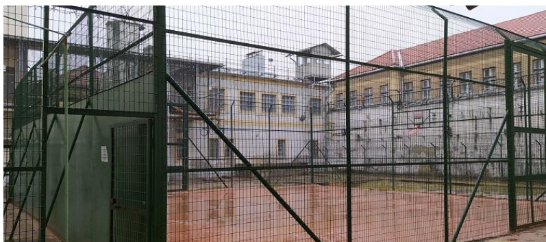
6. Sétaudvar a Székhelyen