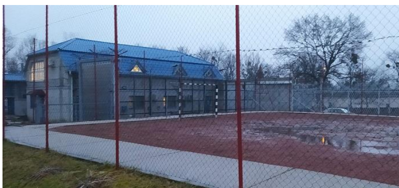
7. Sétaudvar a Telephelyen