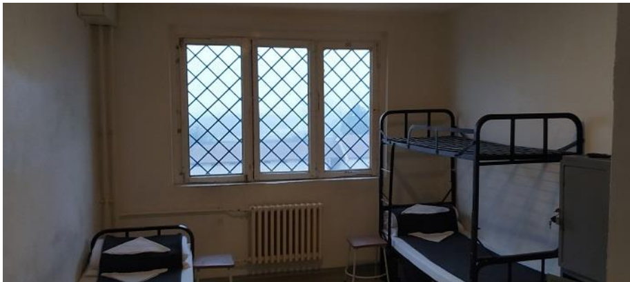
2. Zárka a Telephely F épületében