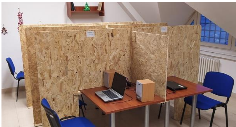
5. Skype végpontok