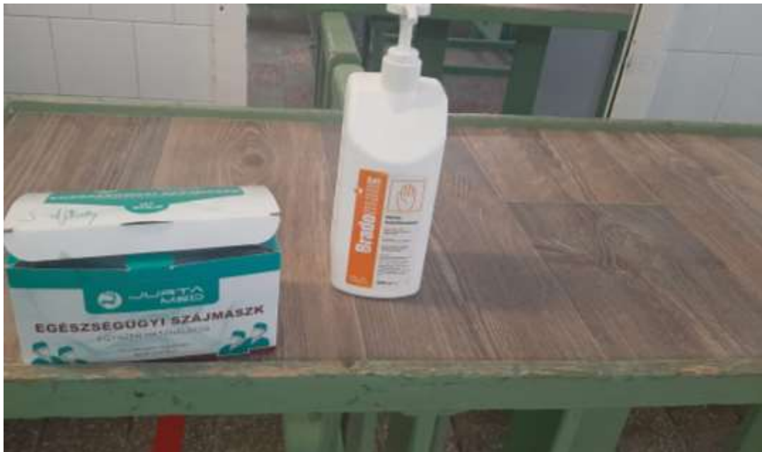
2. számú kép: Kézfertőtlenítő és szájmaszk a személyzet részére