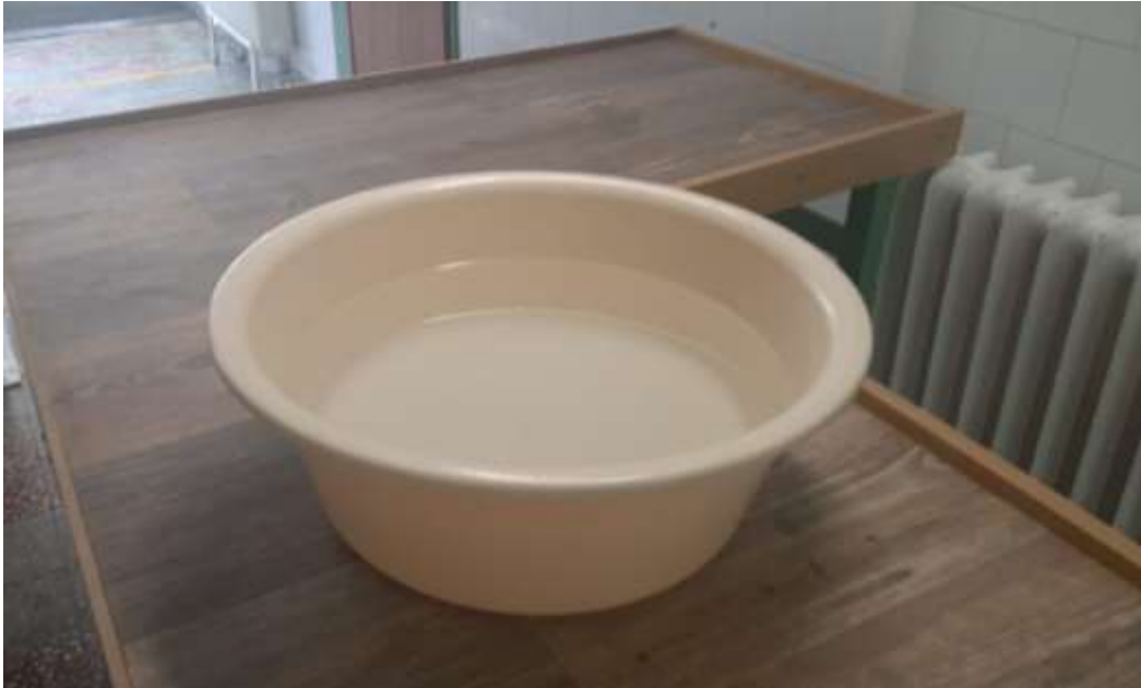
1. számú kép: a fogvatartottak kézmosására használt fertőtlenítőszeres víz