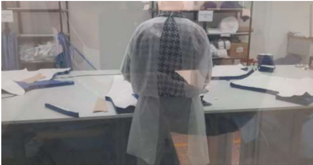
3. számú kép: Munkavégzés