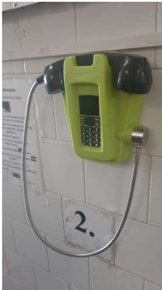
4. számú kép: Fali telefon