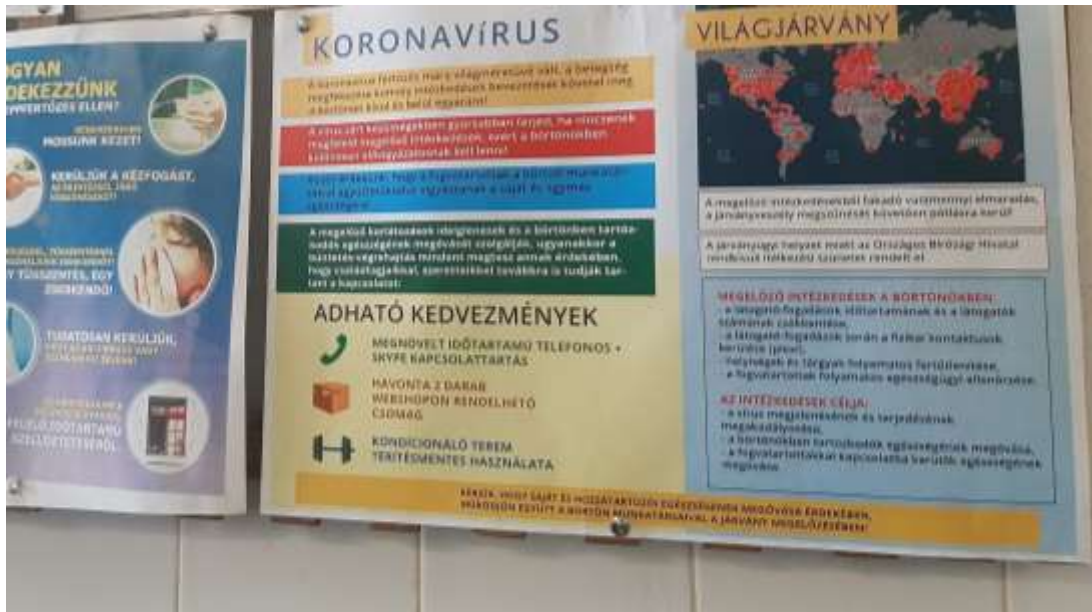
5.számú kép: Faliújság