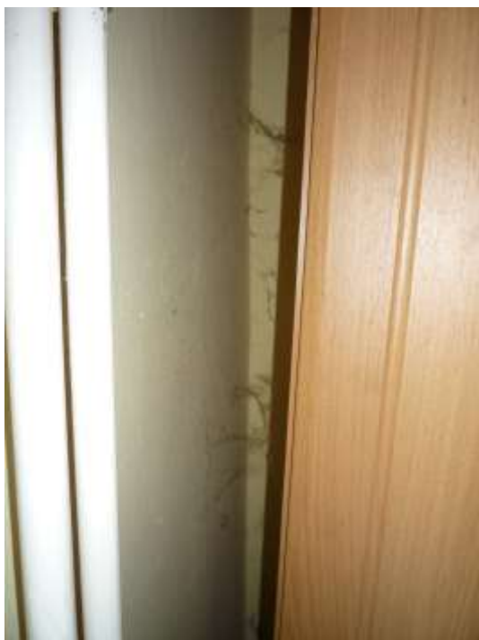
7. számú kép: Pókháló a sarokban