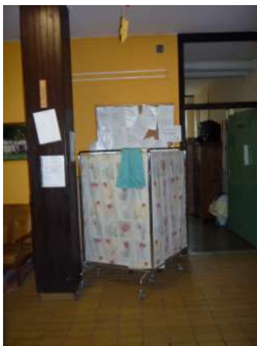
8. számú kép: Faliújság a paraván takarásában