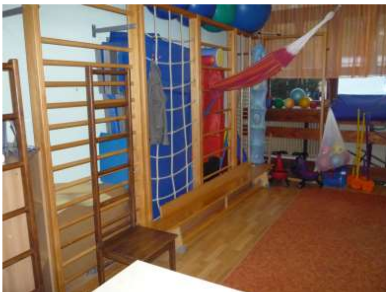
6. számú kép: Foglalkoztató helyiség