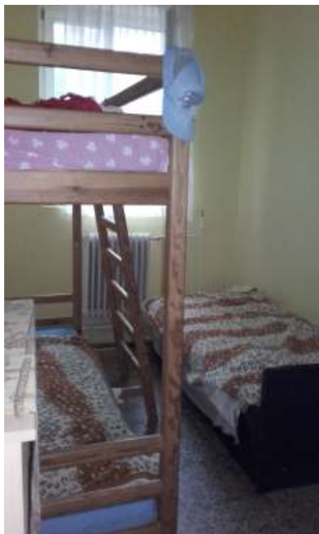
2. számú kép: Zsúfoltság kisebb szobában