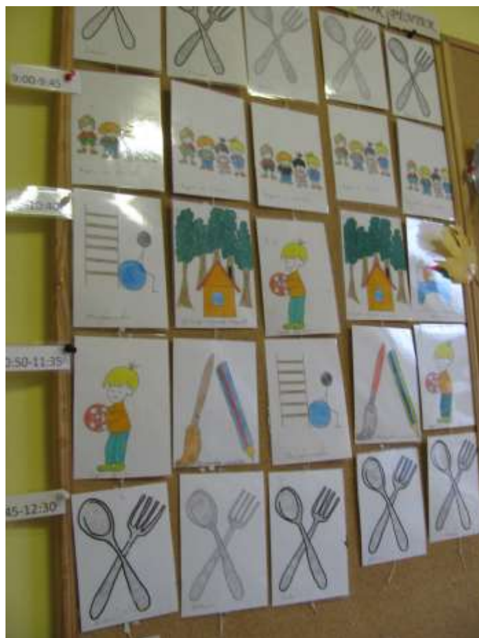
9. számú kép: Órarend