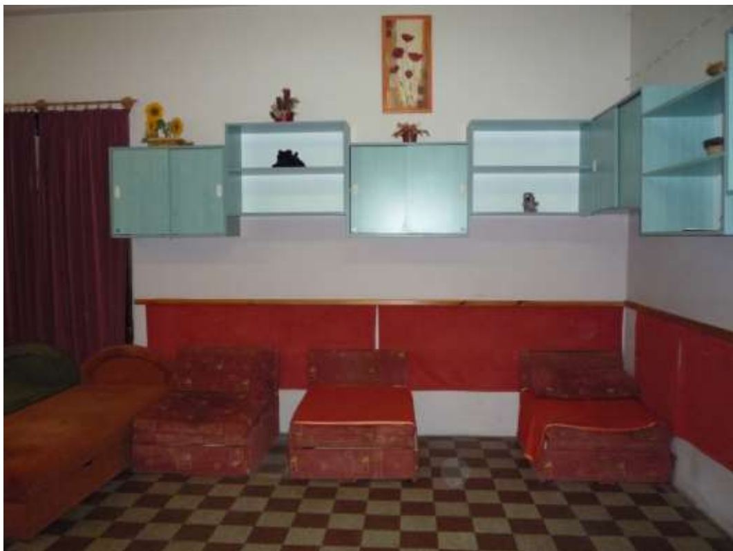
4. számú kép: Sívár polcok az ágyak környezetében