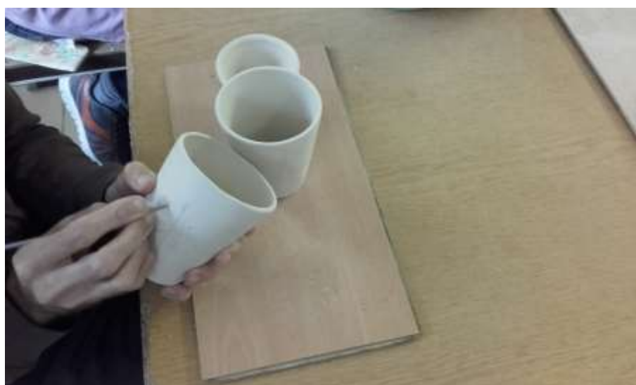
10. számú kép: Kerámiaműhely