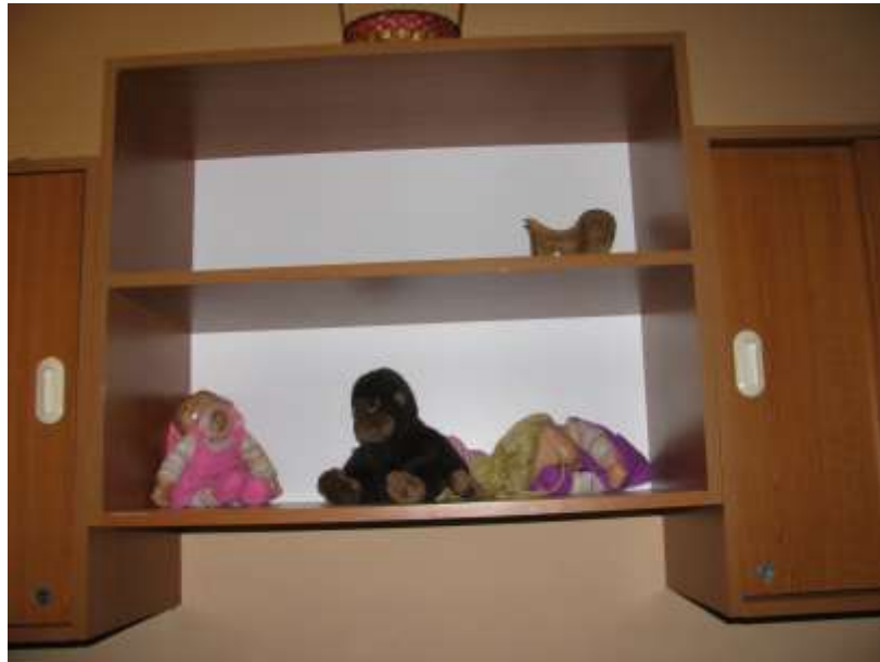
3. számú kép: A letört fejű baba a polcon