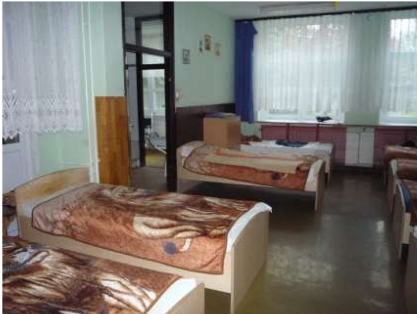
1. számú kép: Zsúfoltság nagy szobában