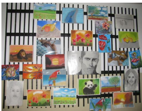
Jobb agyféltekés rajzok