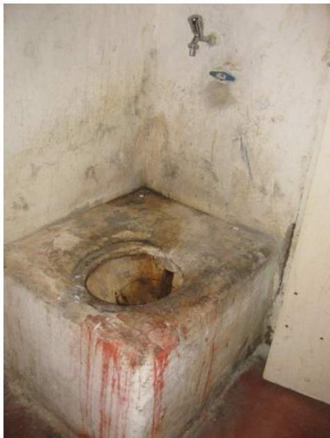
WC a fogda körlet zárkájában