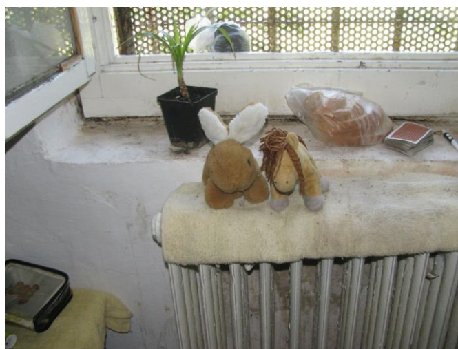
Személyes tárgyak a zárkában